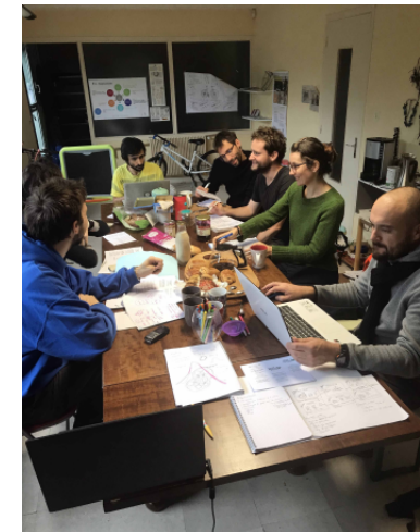
Groupe communication du collectif